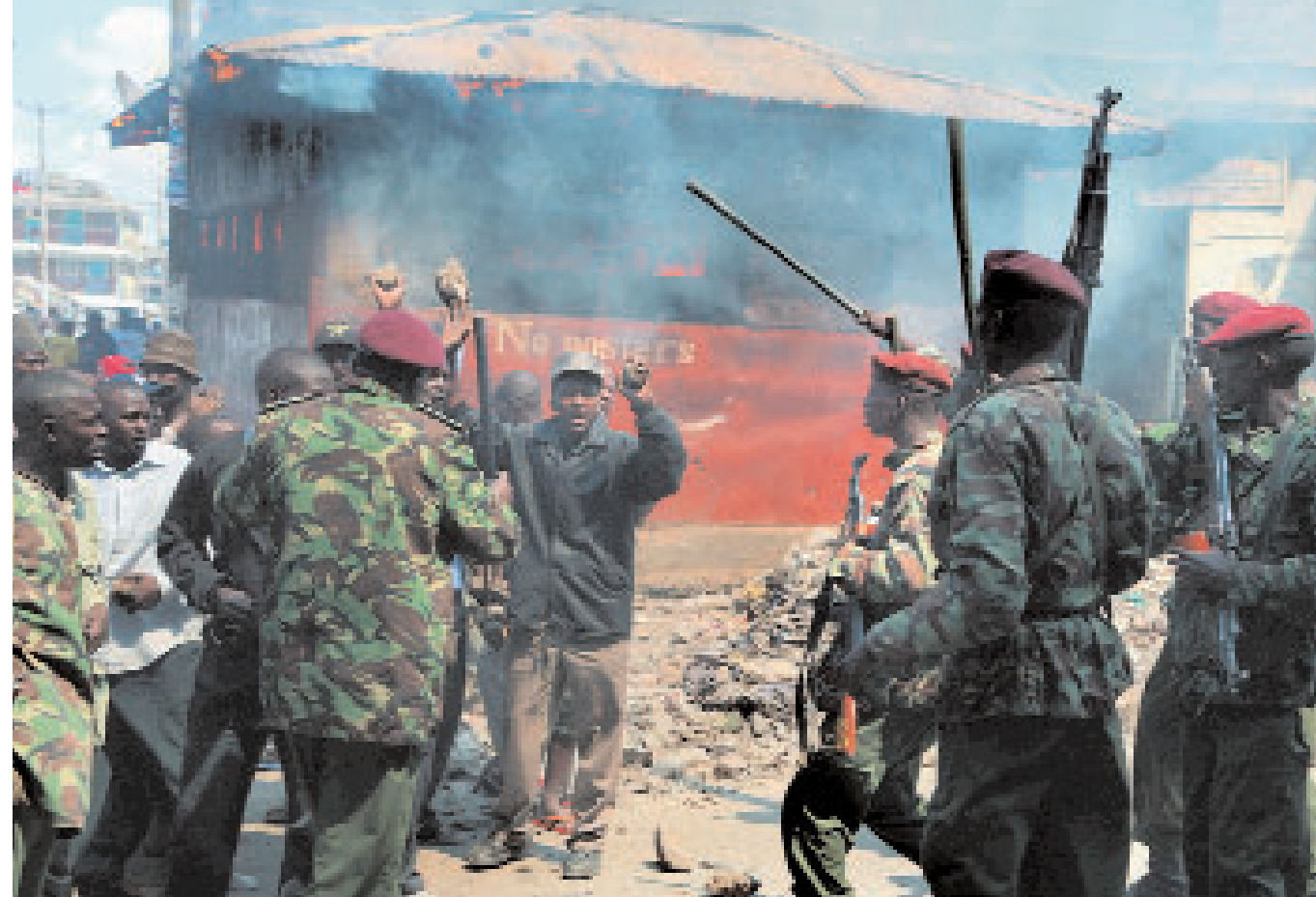
Katastrophennachricht zum Jahresende: blutige Unruhen in Kenya nach den Wahlen.

Das türkische Militär reagierte konsterniert, während die Regierungen der EU-Staaten sich auf den Standpunkt stellten, Gül sei ein gemäßigter Politiker, der sich der Demokratie verpflichtet fühle. Entspricht das den Tatsachen? Als schwierig empfand man in der EU auch die von der offiziellen Türkei geforderte Leugnung des Völkermords an den Armeniern (betreffend die Massaker von 1915) und das erneute Aufblühen des Konflikts mit den Kurden (die türkische Führung sprach da jedoch lediglich, wie bereits erwähnt, von einem Konflikt mit der kurdischen PKK, die ihrerseits mehrere blutige Anschläge auf türkische Sicherheitskräfte im Grenzgebiet zwischen der Türkei und Irak verübte).