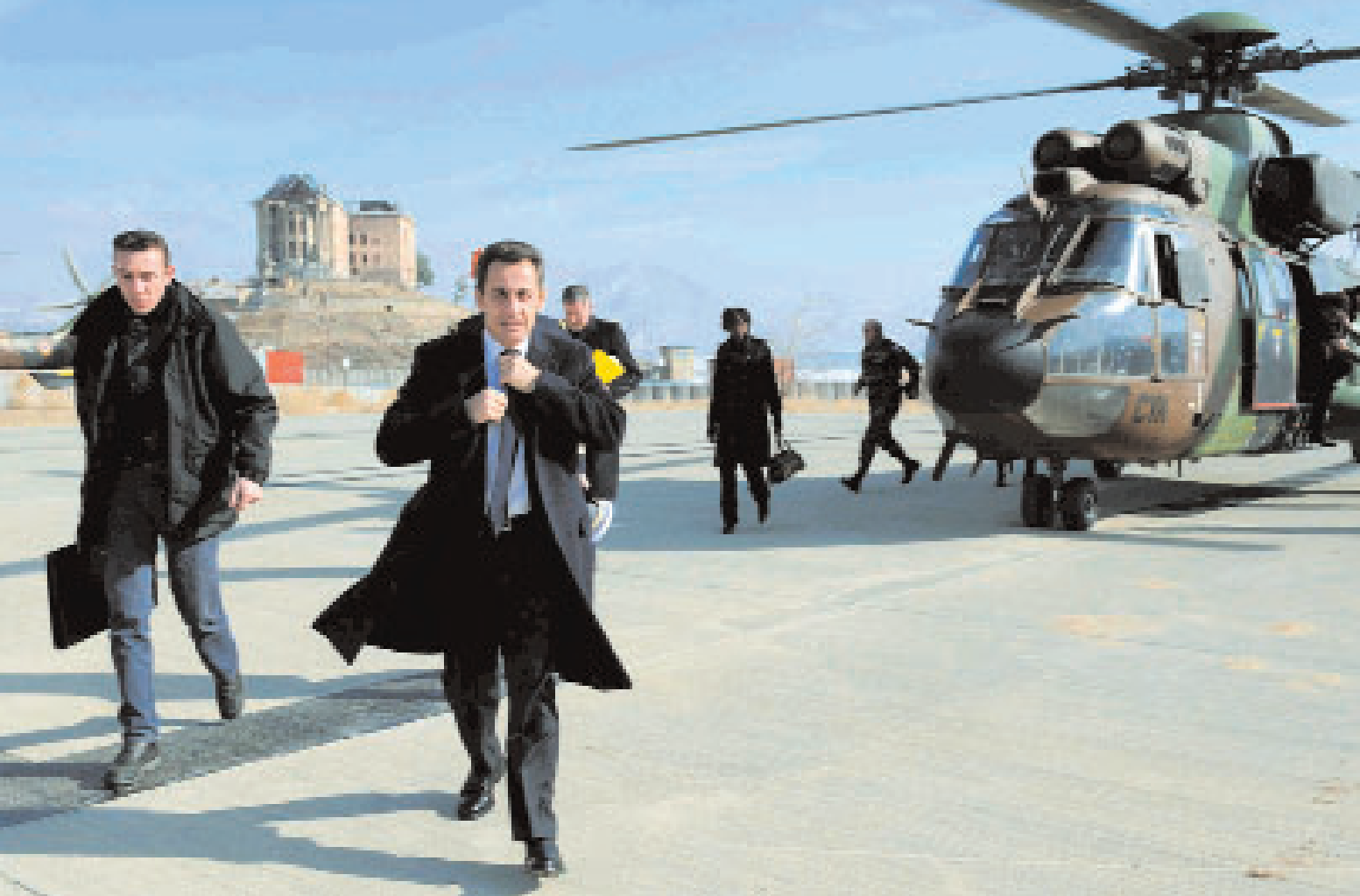
Frankreichs Präsident, Nicolas Sarkozy: rastlos, immer aktiv. Aufnahme: Blitzbesuch in Afghanistan am 22. 12.

2000, ging im Jahr 2007 konsequent weiter. Russlands Wirtschaft wuchs wieder um etwa 7 Prozent, in der Hauptstadt Moskau sogar um 20 Prozent. Landesweit notierte man eine Steigerung der Kaufkraft um 9 Prozent, und wegen der hohen Weltmarktpreise für Erdöl (phasenweise im Verlauf des Jahres 2007 fast 100 Dollar pro Fass, zu Beginn des Jahres 2008 sogar die 100-Dollar-Linie überschreitend) und für Erdgas hatte Russland seine Auslandsschulden vollständig zurückbezahlt und 110 Milliarden Dollar in einen Stabilitätsfonds kanalisieren können. Russland unter der Präsidentschaft von Wladimir Putin : reicher, aber auch unfreier, und gegen Ende des Jahres verdichtete sich die Vermutung, Putin werde auch nach dem Ablauf seiner Präsidentschaft die Geschicke des Landes prägen. Er liess sich von seinem vermutlichen Nachfolger, Dmitri Medwedew , im Dezember bereits als künftiger Premierminister nennen. Unter dem Duo Putin/Medwedew dürfte sich Russland in den kommenden Jahren weiterhin als eigenständige Kraft, mit Distanz zum Westen, profilieren. Was kann das bedeuten? Weitere Marginalisierung der demokratischen Institutionen; Fortsetzung der staatlichen Kontrolle über die Medien (indirekte Zensur, auch Gewalt gegen kritische Journalistinnen und Journalisten); Verflechtung zwischen staatlichen Instanzen und den Führungsgremien in den Schlüsselbereichen der Wirtschaft, vor allem in der Erdöl- und Erdgas-Industrie; Betonung nationaler Interessen; Auf-